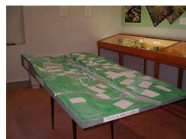
Plastico del Museo all'aperto