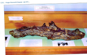
2003 - Il ginepro fossile, dono del dott. Gregor