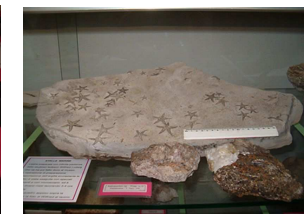
Stelle marine (T. Taro)

Aula Didattica - E' qui possibile apprendere facilmente i primi rudimenti della paleontologia toccando con mano i reperti fossili, e anche osservare in un'apposita postazione i microfossili dello Stirone.