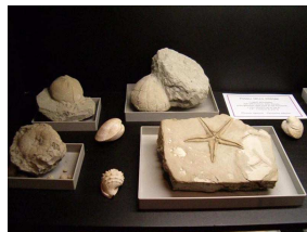
Stella ed echinidi (Stirone)

Sala Minerali - Minerali e fossili dall'Italia e dal mondo, tra cui una preziosa lastra di stelle marine. Una postazione multimediale permette la presentazione di documentari a supporto della visita museale.