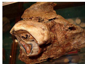
Dente rinoceronte (Stirone)