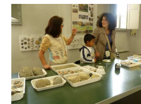
Fossili a portata di mano